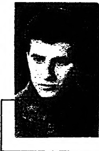
مع السلامة يا صاحب الجلالة لا نريد أن نبتعد شيئا ! مرة أخرى يزورني مد الليل ويرتفع حتى الضحك

الاتحاد ، وفيها روح هذا التشديد ، ومقاطع وأبيات تعيدك إلى جو نشيد داود . وتنشر « الأناور » في ما يلقى مقلما من هذه « السرية » :